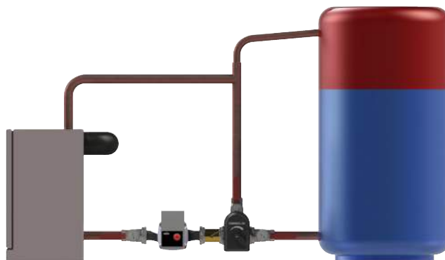
Exempel visar Thermomatic TVM installerad för styrning av returtemperatur till panna, Laddomatic.